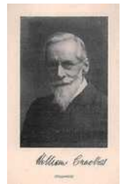
図3. ウィリアム・クルックス

19世紀末に世界的な窒素源不足の危機を指摘したのが、新元素タリウムの発見(1861)やクルックス管（真空放電管の一種で電子の実験に利用）の発明（1875）などで知られる英国の化学者でかつ物理学者のウィリアム・クルックス（1832-1919）です。彼は、1898年の英国科学振興協会での会長就任講演で、食料増産のためには空气中の窒素を利用す