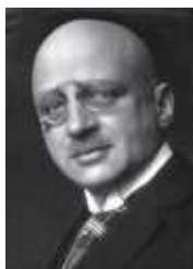
図4.フリッツ・ハーバー

1903年までに空気中の窒素を取り入れる方法がいくつか発明され、世界各国で工業化されましたが、これらの方法は大量の電気を使うなどのためコストが高く、チリ硝石にかないませんでした。安価にしかも大量に空気中の窒素を利用できる技術が求められたのです。