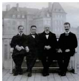
図5.フリッツ・ハーバー(中央右)と田丸節郎(中央左) 1913年頃。建設されて間もない物理化学研究所(現在のフリッツ・ハーバー研究所)

ハーバーは、ドイツで裕福なユダヤ人の家庭に生まれ、ベルリン大学で化学を学ぶなどして1894年からカールスルーエ工科大学で研究と教育をしていましたが、1903年頃から窒素ガスと水素ガスからアンモニアを合成する研究に取り組みました。助手のル・ロシニョールとともに実験をし、苦勞の末、1909年7月にオスミウム触媒を使って温度550℃、圧力175気圧でアンモニアの合成に成功しました。このときは、毎時80gの液体アンモニアが得られました。